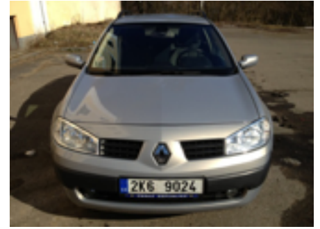
Zepředu celé čelní sklo. Musí být vidět SPZ.