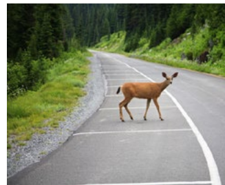
Střet se zvěří