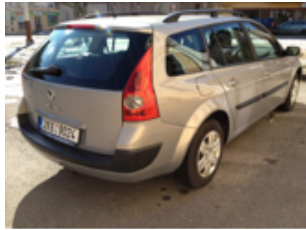
Šikmo zezadu na celý pravý bok.