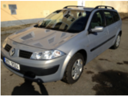
Šikmo zepředu na celý levý bok.